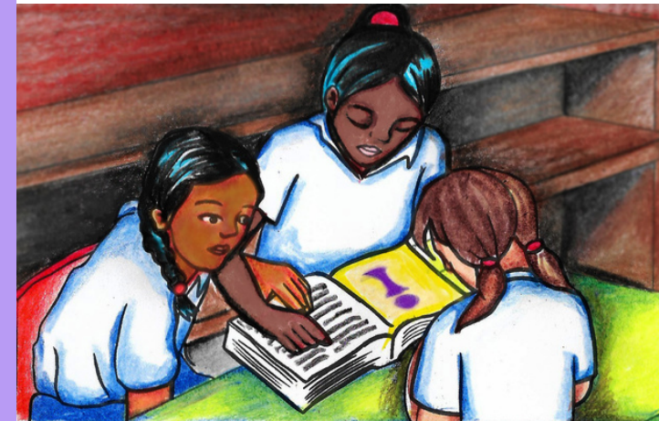
Ilustración: Carla G. Núñez